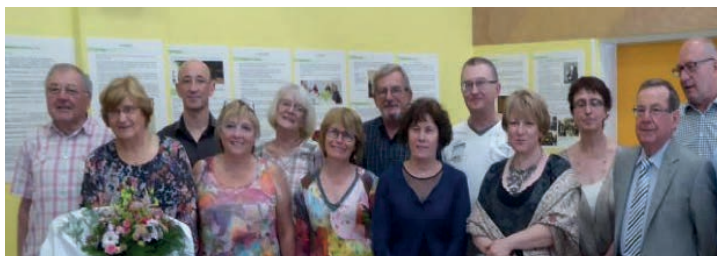
Les anciens présidents et le comité actuel de l'ACL.

L'année 2015 a surtout été celle du 40ème anniversaire de la création de l'ACL.