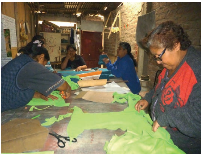
6 : Atelier de formation de couture à Pachacutec.

8 : En préparation pour 2016 : nouveaux programmes au centre de Lima, dans le quartier défavorisé du Rimac.