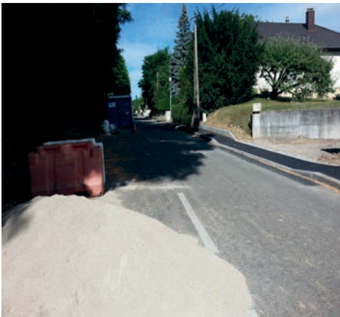
Une bordure pour retenir les enrobés a été posée en limite du domaine public.