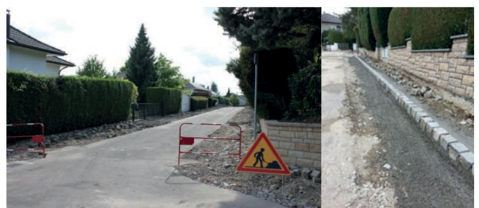
Une bande de roulement a été préservée pour le confort des riverains.