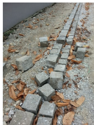
Ces pavés n'ont pas résisté à nos mains... travail à refaire.