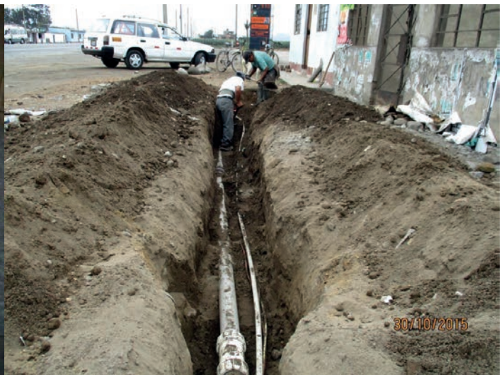
7 : Adduction en eau pour 400 personnes