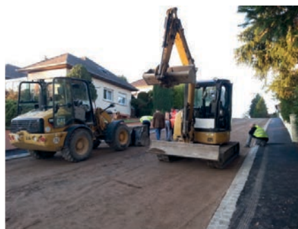
Contrôle de la plate-forme avant pose des enrobés sur la chaussée, les trottoirs sont déjà réalisés.