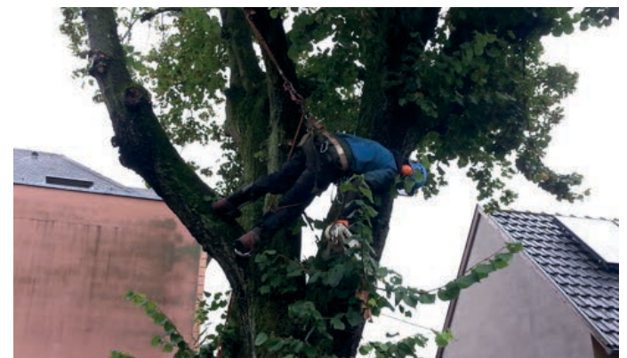
Encordé, jouant avec sa tyrolienne le technicien passait de branches en branches.

À l'école, un magnifique tilleul agrmente la cour. De nombreuses branches abîmées ou mortes ont nécessité la sécurisation de cet arbre. Nous avons fait appel à des spécialistes de l'élagage pour effectuer ces travaux spectaculaires.