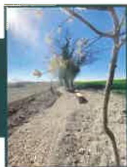
Bancs réalisés par nos ouvriers