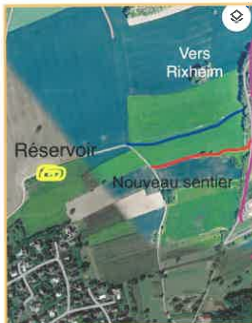
Plan Google Maps :

en bleu : chemin sauvage à travers les cultures en rouge : nouveau sentier officiel créé par la commune en violet : chemin allant de Zimmersheim à Rixheim au Habsheim