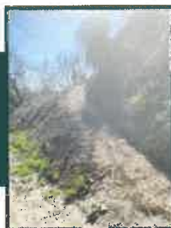
Accès côté chemin menant à Rixheim.