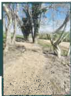
Cheminement à travers le bosquet d'arbres.