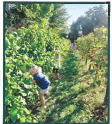
Au mois de septembre, les élèves de l'école primaire de Zimmersheim ont fait les vendanges à l'arboretum, aidés par de nombreux parents et grands-parents ainsi que par les bénévoles qui s'occupent du raisin toute l'année.

La classe de l'élémentaire a travaillé toute une période pour monter une pièce de théâtre, que les élèves ont pu présenter à leurs familles début janvier. Ce fut une réussite. La classe des plus jeunes découvre le monde de la danse, et participera à un bal «Copains qui dansent» avec d'autres classes de villages voisins à la fin du mois de mai.