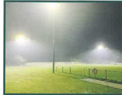
Essais d'éclairage avec les nouveaux lampadaires LEDs, installés par l'entreprise locale ETPE.

La consommation de l'ensemble a largement diminuée, passant de 27 KW à 14, mais le civisme reste de mise. Notre installation est classé EFoot A 11 pour l'éclairage, les vestiaires et la taille du terrain. La norme nous impose un minimum d'éclairage moyen de 157 LUX et une uniformité de 0,57. Cette classification nous autorise à participer à des matchs au niveau départemental.