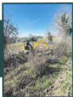
Gros travaux de débroussaillage réalisés en partie avec une pelle mécanique

Nous avons acquis et échangé des parcelles pour pouvoir faire un sentier qui permet d'éviter ce grand détour. Ce sont nos ouvriers qui ont retroussé les manches et ont tracé ce nouveau sentier.