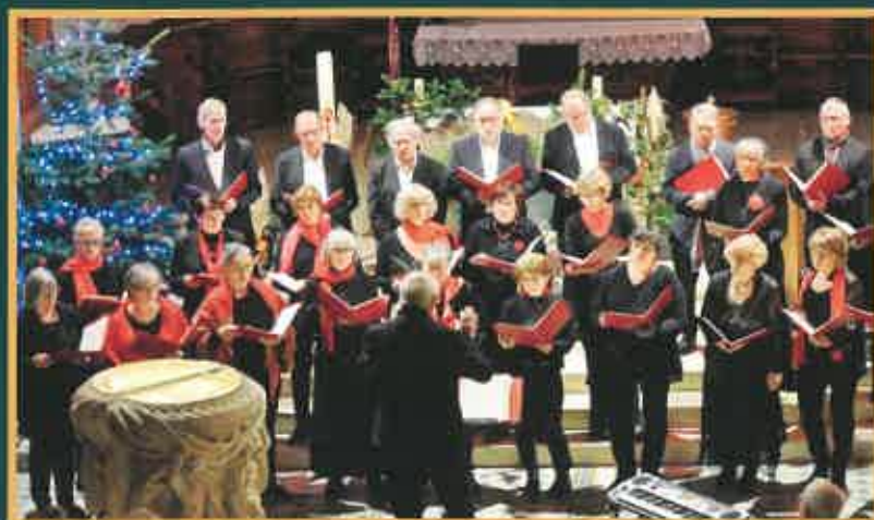
Noël 2022 Concert Église de Zimmersheim

Véritable challenge que de vouloir préparer un concert en 3 mois avec un groupe qui venait à peine de se constituer ... mais pari réussi grâce au dynamisme de notre direction bicéphale et à l'enthousiasme et la ténacité de chacun des choristes qui se sont investis à fond dans ce projet.