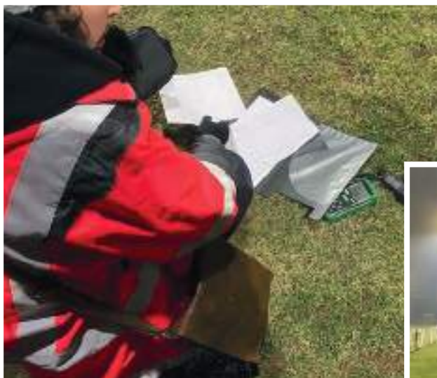
Vérification de la puissance d'éclairage, 198 LUX au sol, soit 25% de plus, mais les projecteurs sont neufs et donc exempts de poussières.

Contrairement aux opérations précédentes réalisées en régie, cette opération a nécessité l'intervention d'une entreprise spécialisée. Nous n'étions pas en capacité de calibrer les puissances des projecteurs afin d'obtenir une uniformité suffisante de l'éclairage du terrain comme l'impose la fédération. De plus, notre nacelle ne nous permet pas d'accéder à la hauteur des mâts.