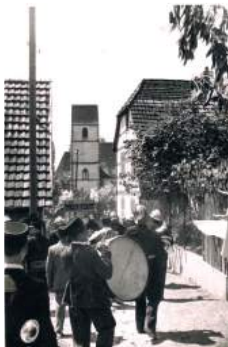
Procession de la Fête Dieu à Zimmersheim. Lors de son passage dans la rue du Monastère. A noter la présence de la clique des Sapeurs Pompiers