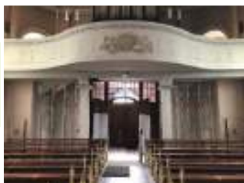
Etayage de la tribune pendant les travaux

Nous ne cherchons pas d'éloges, notre rôle est de préserver le patrimoine et surtout d'assurer la sécurité, mais également d'apporter de la satisfaction et du confort aux paroissiens pendant les célébrations.