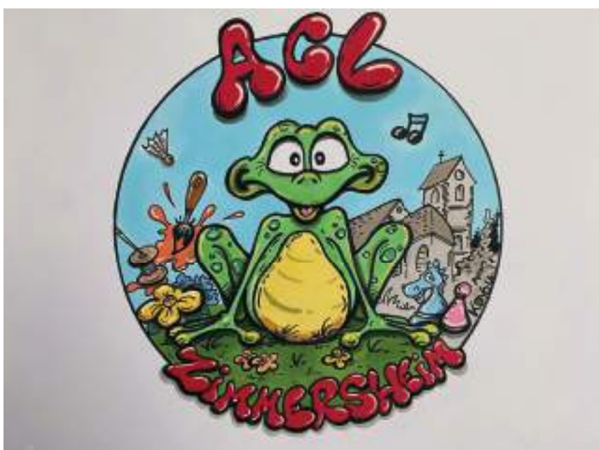
L'ACL Zimmersheim vue par Kayou

Le comité de l'ACL contact@aclzimm.fr ou https://www.aclzimm.fr/