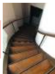
Nez de marche antidérapants et contrastés