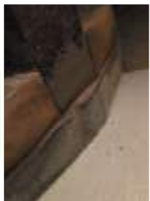
Après: Poutre reposant sur une ceinture béton