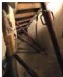
Etayage des cagibis