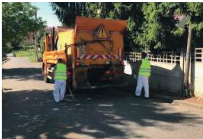
Vérification de la puissance d'éclairage, 198 LUX au sol, soit 25% de plus, mais les projecteurs sont neufs et donc exempts de poussières.

Cette technique est indispensable pour maintenir en état les chaussées et éviter ainsi qu'elles ne se dégradent trop rapidement après les périodes de gels en hiver ou des périodes de sécheresse engendrant de facto des coûts de réparation beaucoup plus élevés