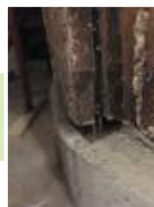
Armatures en fer rapportées dans le bois