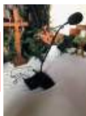
Micro, sans fil au sol