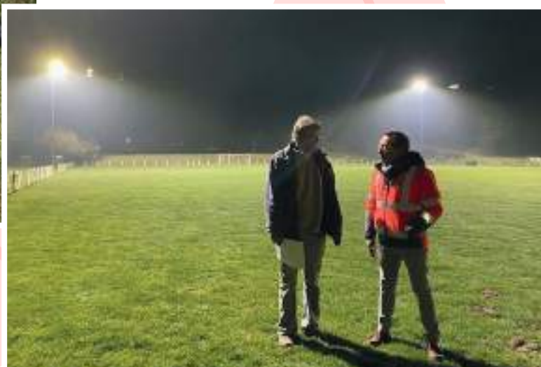
M. le maire en discussion avec le président de l'entreprise ETPÉ, lors de la réception des travaux.