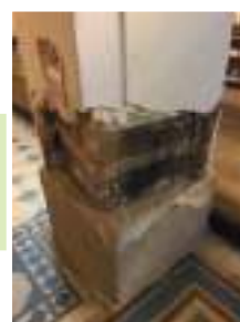
Point de sondage sur pilier