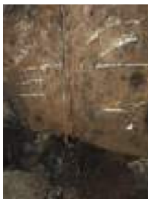
Avant: Poutre reposant sur le limon

Le problème de l'affaissement progressif de la tribune (relaté dans le dernier bulletin), qui perdurait depuis des années, dû au mérule dans les poutres de soutènement reposant sur le limon, a enfin pu être résolu grâce aux travaux réalisés depuis la mi-août et achevés fin novembre. Ce n'était pas une mince affaire, différents corps de métier ont dû intervenir sur le chantier. Entre la démolition gros oeuvre, charpente, traitement de charpente, électricité, plâtrerie, menuiserie et peinture, les travaux se sont enchainés et furent supervisés par le maître d'oeuvre; le Cabinet d'Architecture BADER en organisant régulièrement une réunion de chantier.