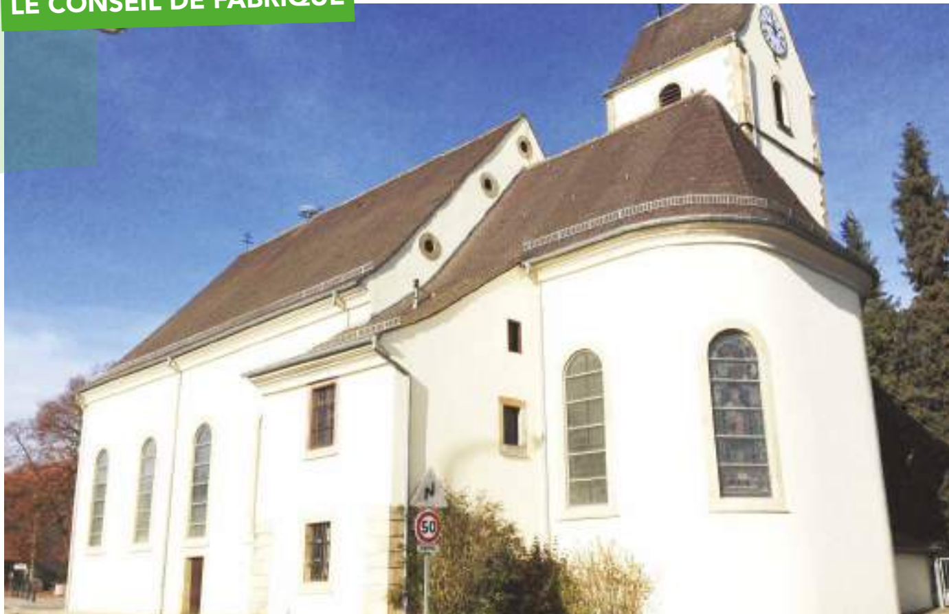
Eglise Notre Dame de l'Assomption de ZIMMERSHEIM