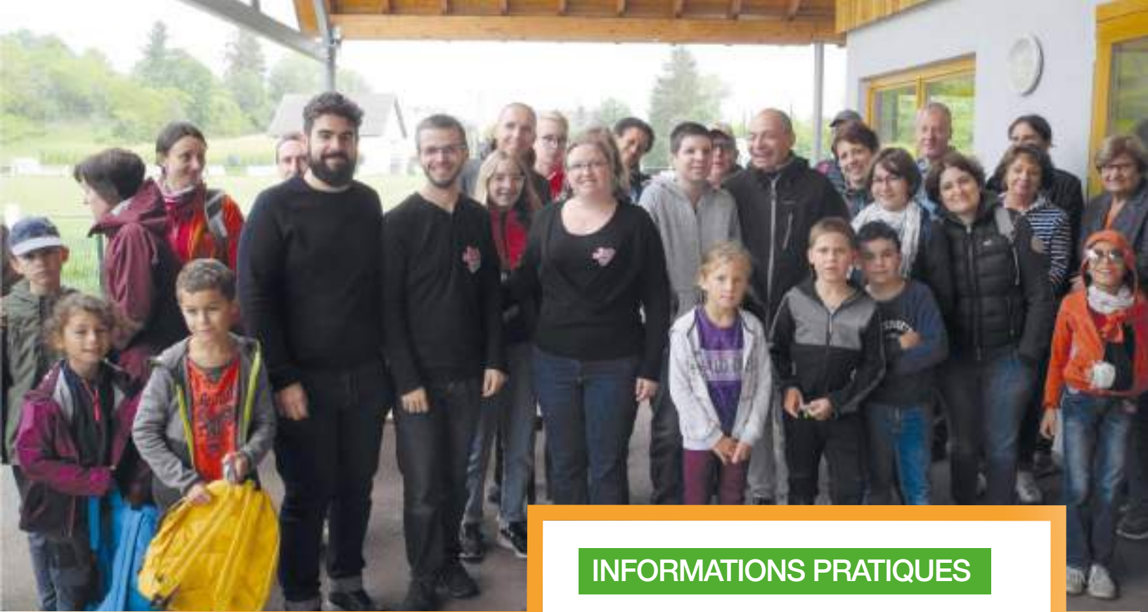
Remise des diplômes pour le rallye pédestre