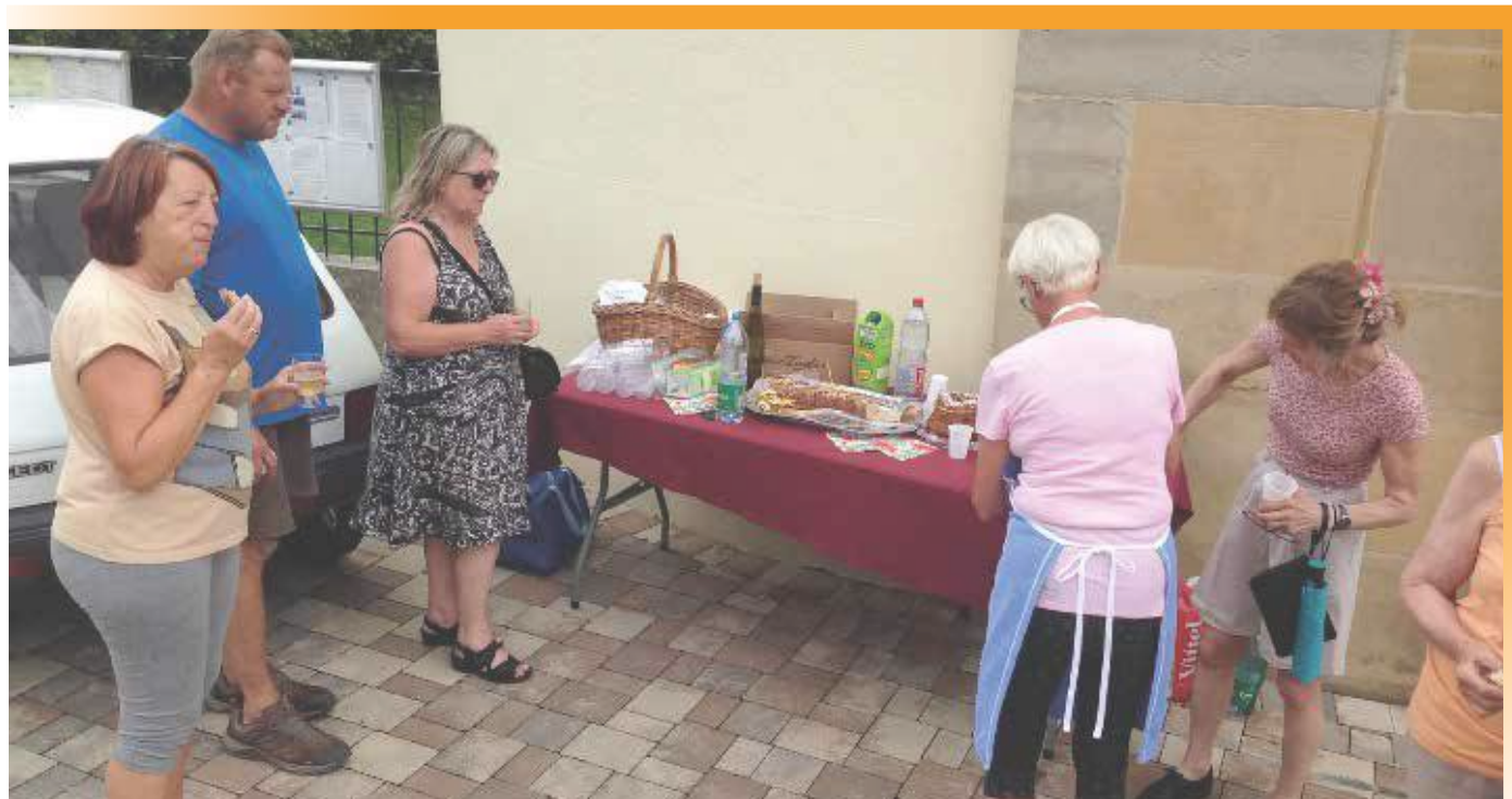
Le bon buffet

Merci à celles et ceux qui nous font tressaillir par des concerts et que nous avons toujours plaisir à accueillir dans notre belle église, je veux parler des choristes de la PASTOURELLE qui nous font, chaque année, l'honneur d'une belle prestation d'été et de l'Avent.