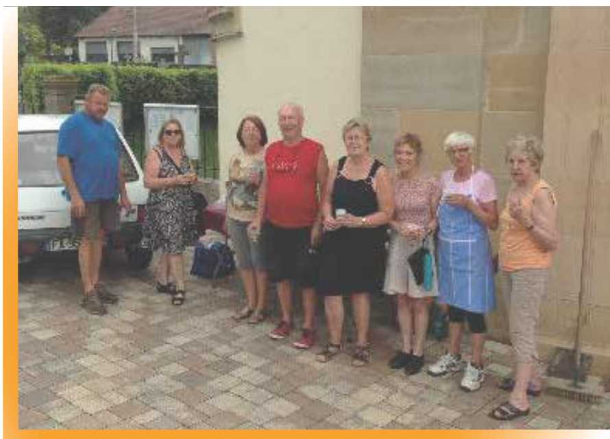
Nettoyage annuel de l'église

Au mois de juillet une équipe éphémère s'est constituée, issue de groupes bénévoles intervenant tout au long de l'année, pour le grand nettoyage annuel de l'église et du cimetière. Pas moins de treize personnes ont contribué dans la bonne ambiance aux différentes tâches. A l'issue de cette matinée de travail, un verre de l'amitié a été servi.