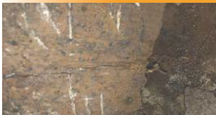
Poteau se soutènement de la tribune, vue 1

Le Conseil de Fabrique donne une grande priorité à cette urgence pour la sécurité de nos paroissiens. C'est pourquoi nous serons amenés à faire réaliser de gros travaux d'étayage en 2020