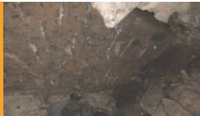
Poteau se soutènement de la tribune, vue 2