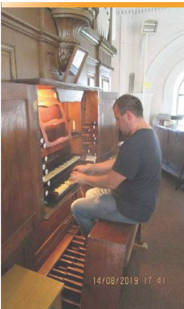
Superposition des jeux