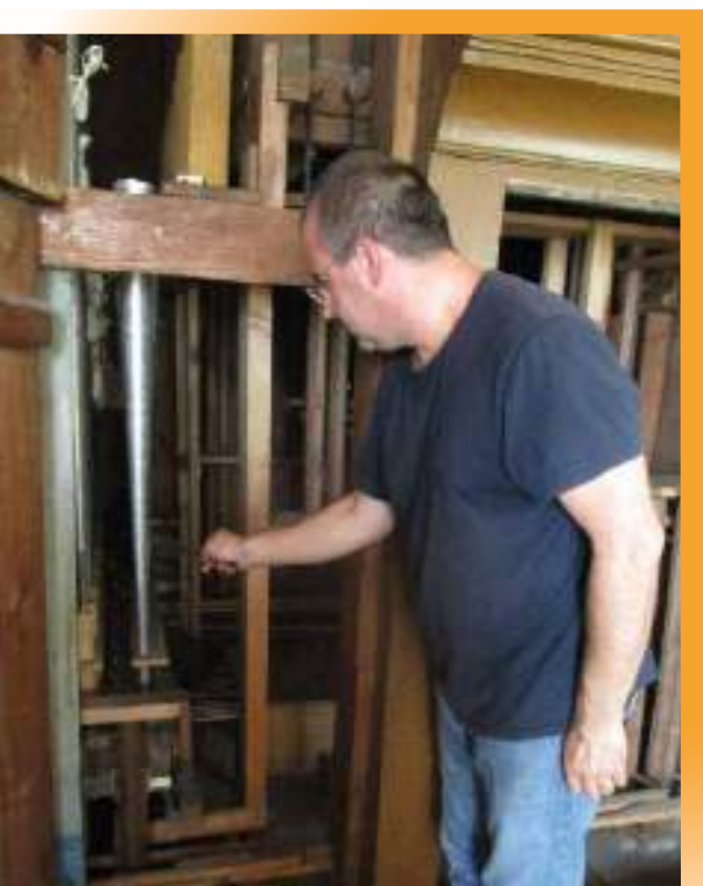
Accordage des tuyaux