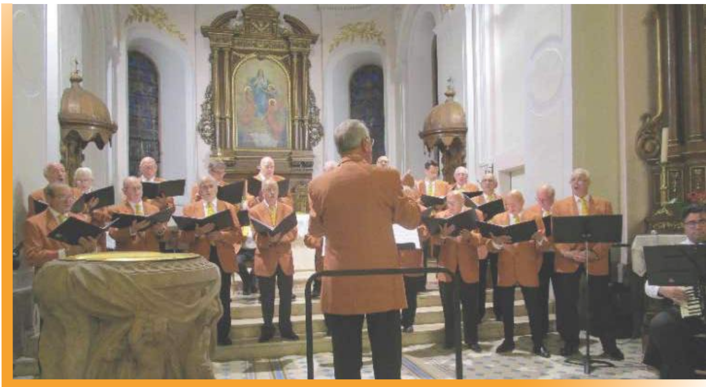
La CHORALE des MAITRES BOULANGERS